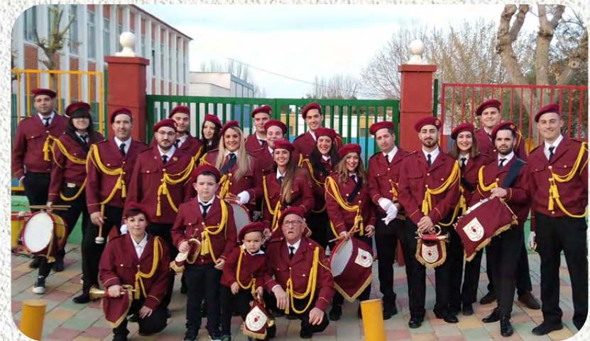
Asociación de Tambores y Cornetas "Virgen de los Dolores"