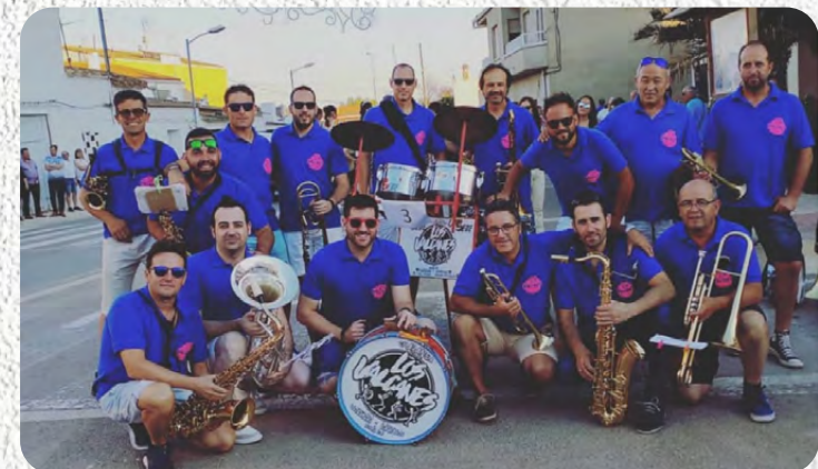
Charanga "Los Valcanes"