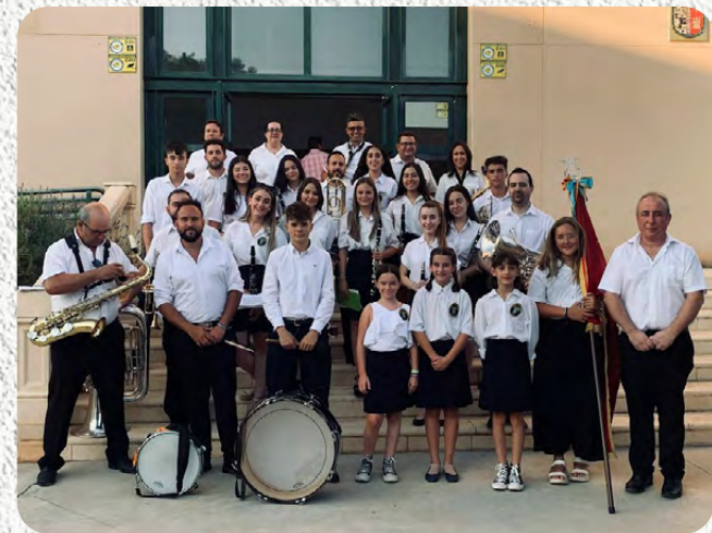
Asociación Musical "San Roque"